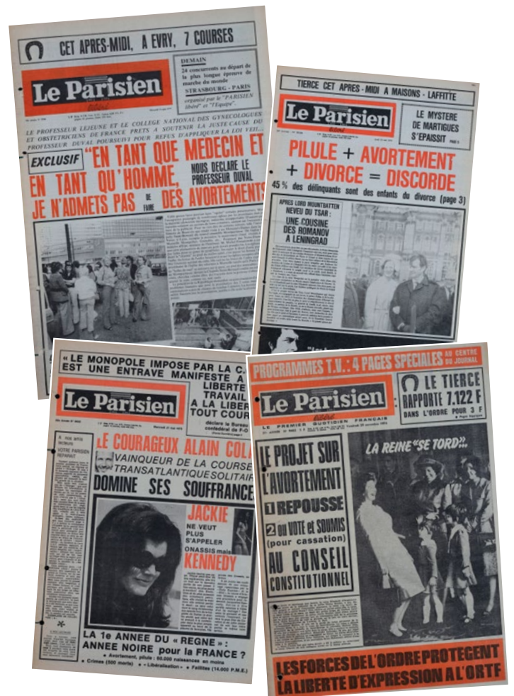
Unes d'époque du Parisien

Dans les années 70, les principales méthodes de contraception restent le retrait et Ogino (période d'abstinence sexuelle pendant la période de fécondité de la femme); des centaines de femmes meurent chaque année des suites d'avortements clandestins. Indigné·es, des médecins militant·es et des féministes fondent en 1973 le MLAC, qui réclame la diffusion d'une information sexuelle, la liberté de la contraception et de l'avortement. Ils et elles font le choix de la désobéissance civile de masse, en bafouant ouvertement la loi. Ainsi pendant près de 18 mois dans de nombreuses villes de France, leurs bénévoles pratiquent des avortements grâce à la méthode Karman. Cette méthode consiste à aspirer le contenu de l'utérus à l'aide d'une canule : c'est indolore, peu coûteux, très simple à appliquer et à enseigner. L'association organise aussi des voyages pour avorter à l'étranger pour celles qui ont dépassé 8 semaines de grossesse. Face à l'ampleur du mouvement, le gouvernement n'a d'autre choix que de faire voter la loi pour la légalisation de l'avortement en 1975.