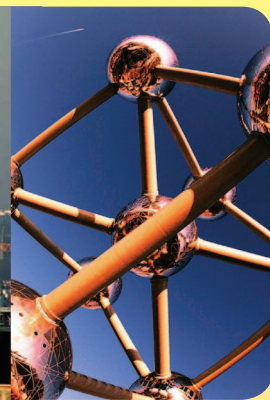
Amsterdam, Berlijn, Sitges en Brussel