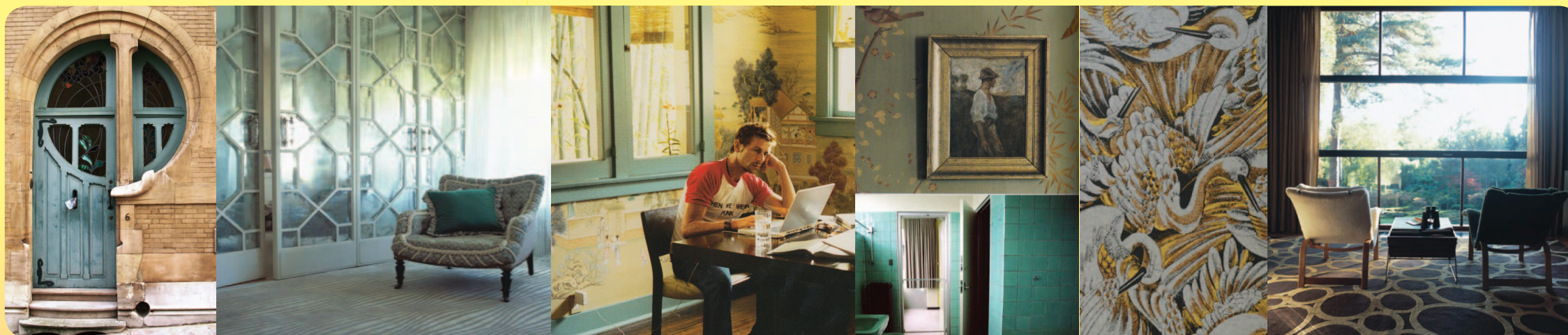
Mood Huis Eduard en vlooiemarkt in Brussel